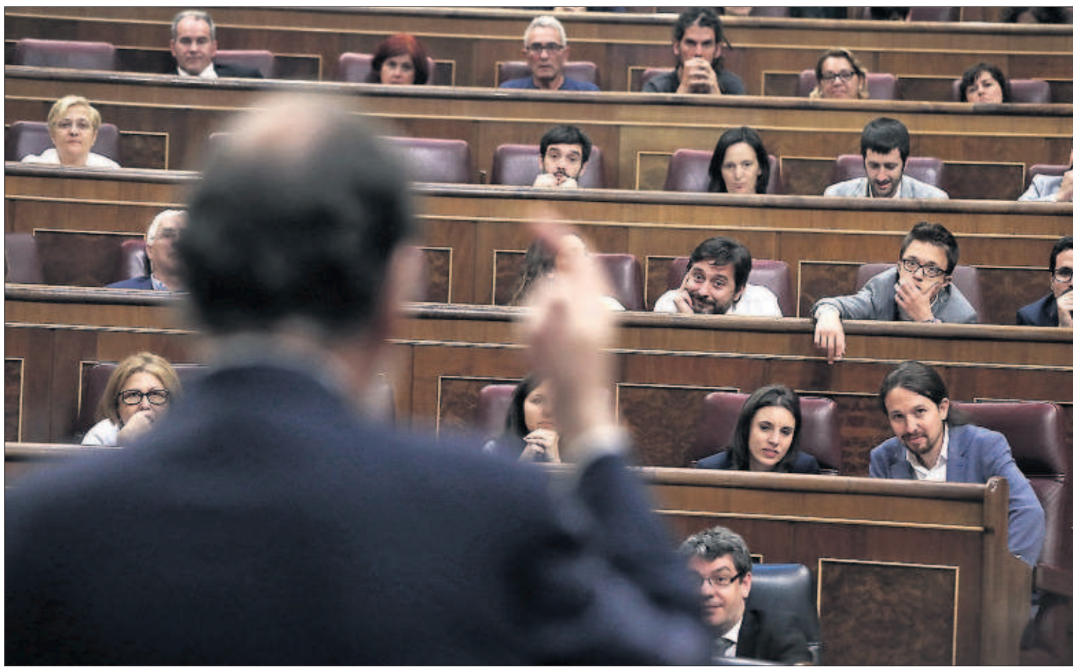
RAJOY ENTRA AL DUELO DE PROTAGONISMO CON IGLESIAS. El presidente del Gobierno español, Mariano Rajoy, y el líder de Podemos, Pablo Iglesias, se enfrentaron ayer duramente en el Congreso. El jefe del Ejecutivo asumió en solitario la respuesta a la moción de censura y su defensa ante las acusaciones de corrupción fue cuestionar la credibilidad de Iglesias. PÁGINAS 20 A 24 EDITORIAL EN LA PÁGINA 16

nados desde Moscú contra Hillary Clinton, la rival demócrata de Trump en las elecciones de noviembre. El fiscal tampoco ayudó a despejar las dudas sobre las presiones del presidente al exdirector del FBI James Comey, a quien despidió el mandatario. “Su silencio dice mucho”, sentenció un senador. PÁGINA 7