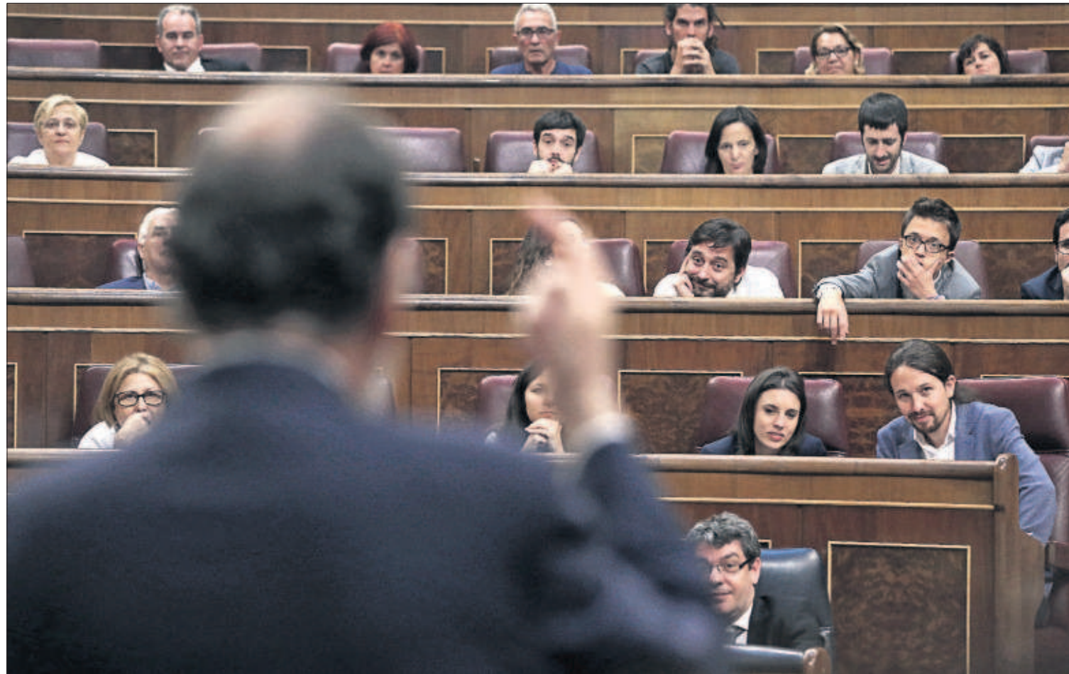
Pablo Iglesias (a la derecha, en la segunda fila) y el resto de la bancada de Podemos siguen la intervención de Mariano Rajoy durante su réplica.

ante las acusaciones de corrupción fue cuestionar la credibilidad de Iglesias y arremeter contra su radicalidad. Pero al mismo tiempo, el hecho de responderle elevó el papel de Podemos como oposición ante un PSOE ausente que, con su abstención, eligió ponerse de perfil. PÁGINAS 16 A 20