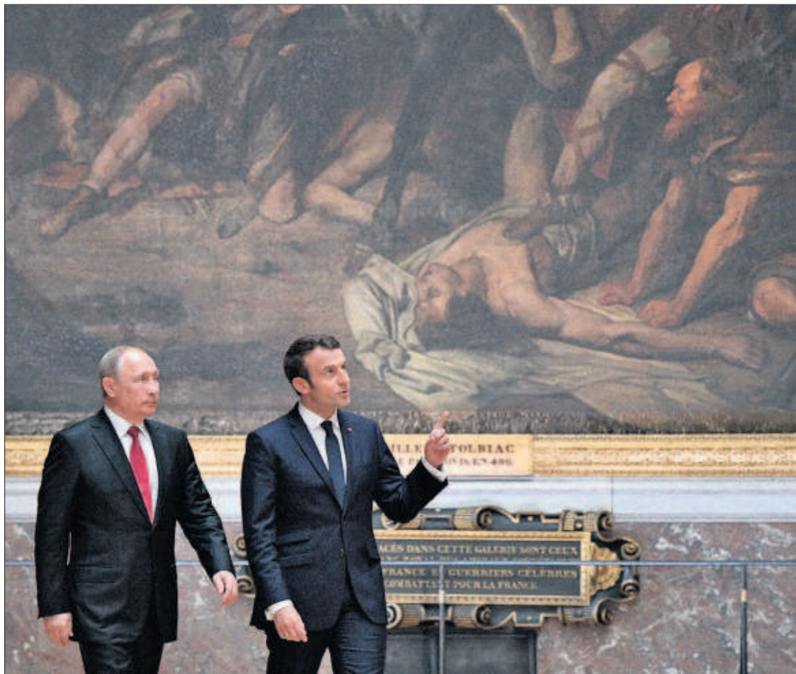
Vladimir Putin (izquierda) y Emmanuel Macron, ayer en el palacio de Versalles.

PHotoEspaña une ambos lados del Atlántico P25