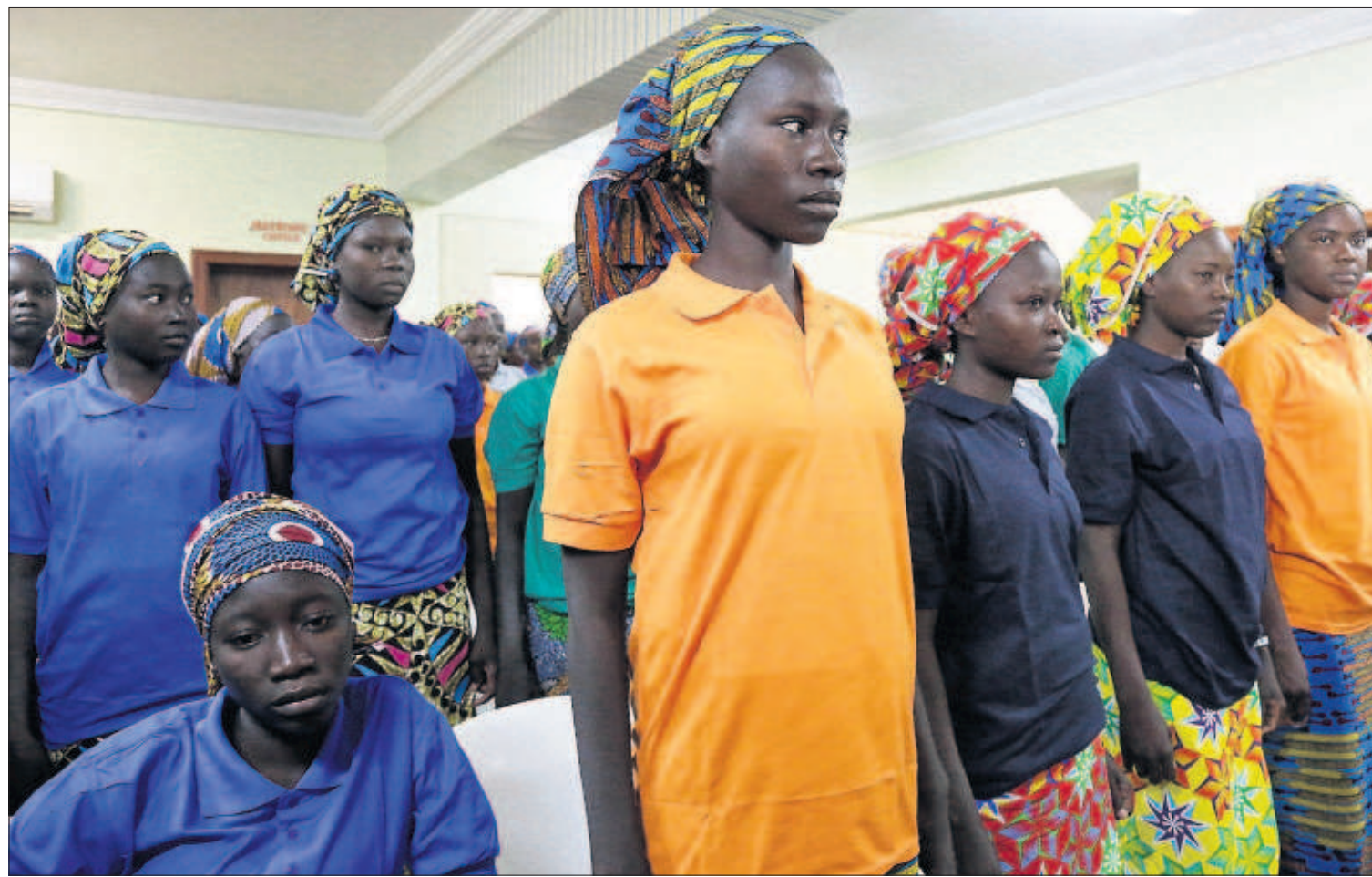
LAS NIÑAS SECUESTRADAS POR BOKO HARAM DESCUBREN POR FIN SUS ROSTROS EN LIBERTAD. La ONU celebró ayer la liberación de 82 estudiantes nigerianas secuestradas hace tres años por el grupo terrorista Boko Haram y pidió a todos sus conciudadanos que apoyen su reintegración en la sociedad y las acepten completamente. El presidente del país las recibió en Abuja e hizo públicas sus identidades. PÁGINA 12