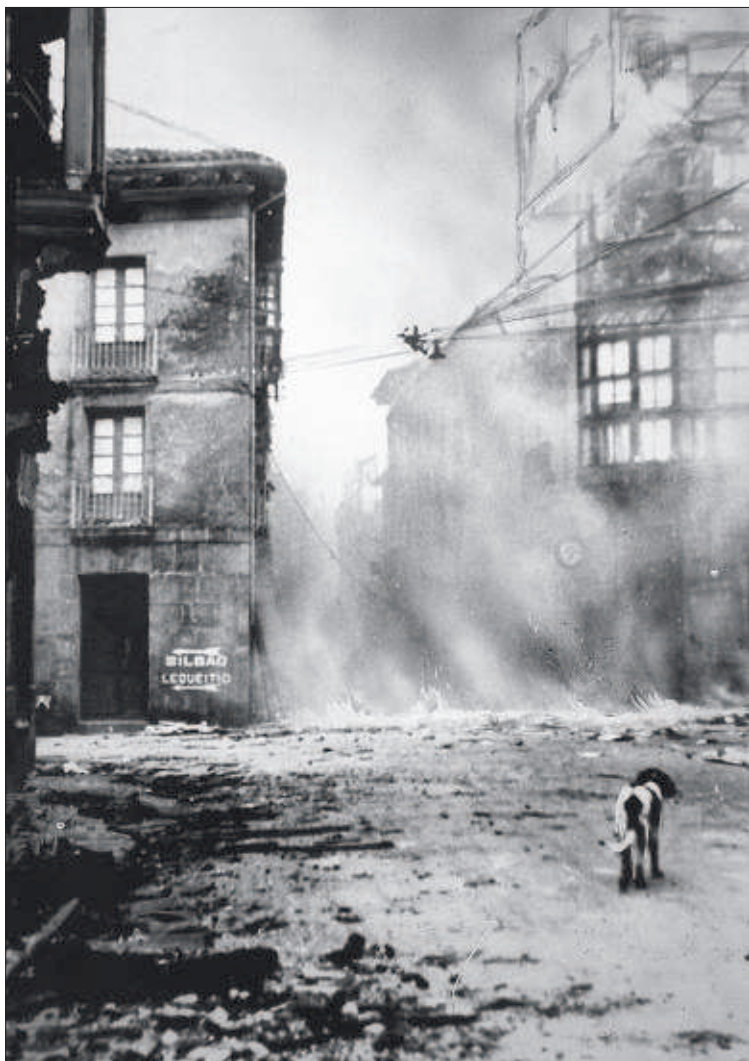
Confluencia de la calle Artekale con la de San Juan, en Gernika (España), durante el bombardeo de 1937 y en la actualidad.

cicletas y, en ocasiones, cubren sus rostros para evitar ser identificados. Hace tres años que salieron de sus trincheras, en el barrio 23 de Enero de Caracas, para colonizar otros territorios. Sus intervenciones armadas en las protestas de la oposición coincidieron con el declive de la popularidad de Nicolás Maduro. PÁGINA 10