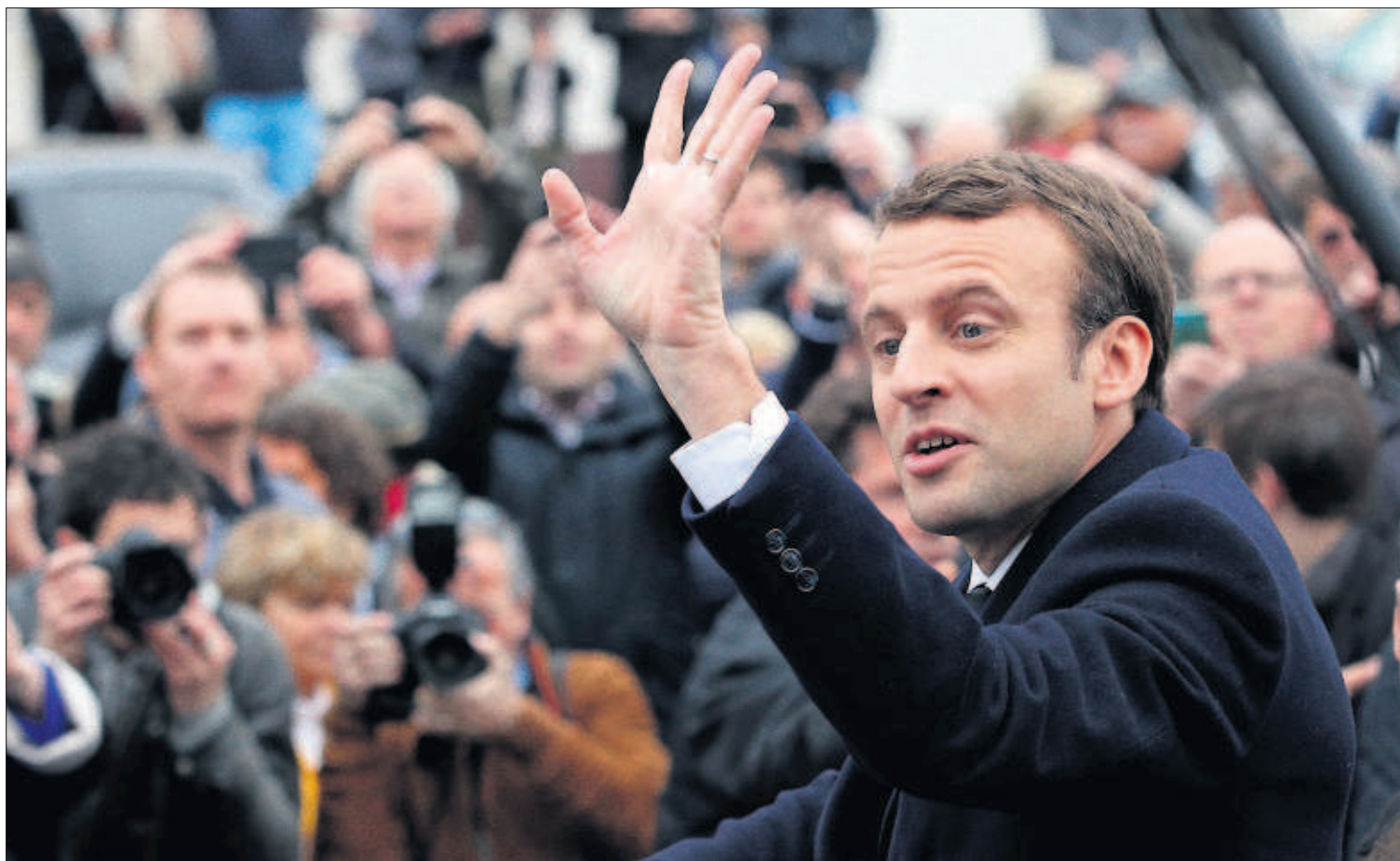
El candidato de En Marche!, Emmanuel Macron, saluda a sus seguidores tras votar ayer en Le Touquet, en el norte de Francia.

sus rivales derrotados ayer. Tanto el conservador François Fillon como el socialista Benoît Hamon pidieron el voto para Macron tras reconocer el fracaso de los dos partidos tradicionales de la política francesa. Por primera vez desde la II Guerra Mundial no habrá un candidato conservador en la elección final. El socialista, partido en el Gobierno, tuvo el peor resultado desde 1969. PÁGINAS 3 A 8