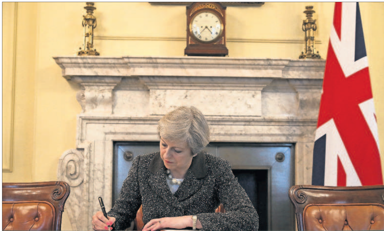
Theresa May firma la carta a la presidencia europea para activar la salida de Reino Unido de la UE, anoche en su despacho.