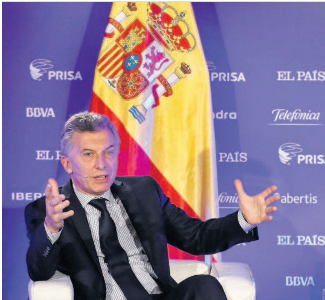
El presidente argentino, Mauricio Macri, ayer en el foro organizado por EL PAÍS.

Otro de sus blancos fue el libre comercio, con lo que seduce desde su campaña a las zonas industriales en decadencia de mayoría blanca. "Les dije a Ford, Chrysler, Fiat, a la gran industria, que volviesen a invertir aquí y ahora lo están haciendo", dijo acerca del flujo que ha ido en detrimento de la economía mexicana. PÁGINA 3