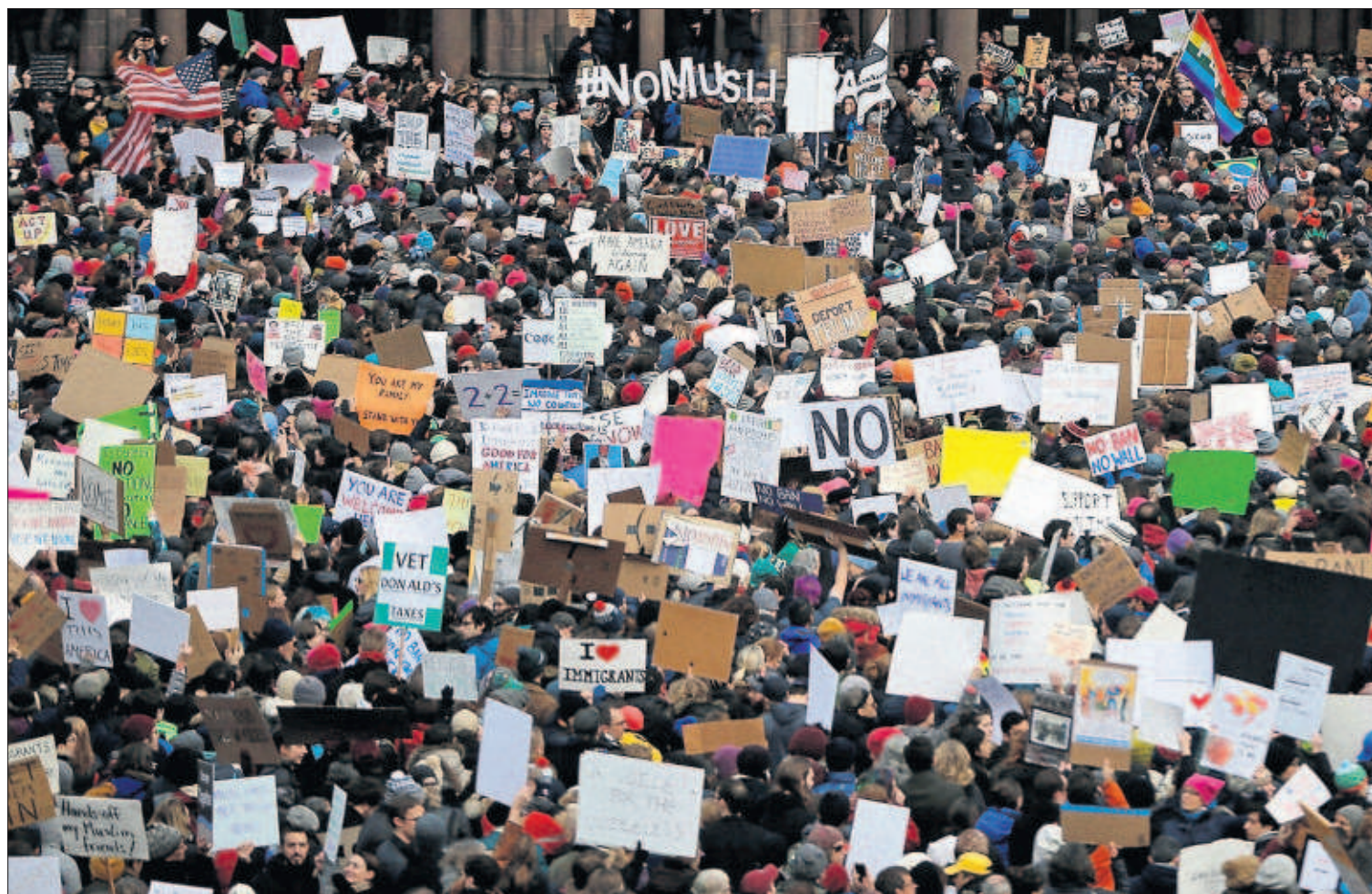
Manifestación en la plaza Copley de Boston (Massachusetts) contra el decreto de Donald Trump.

Desolación en Irán: “Es una gran injusticia” P4