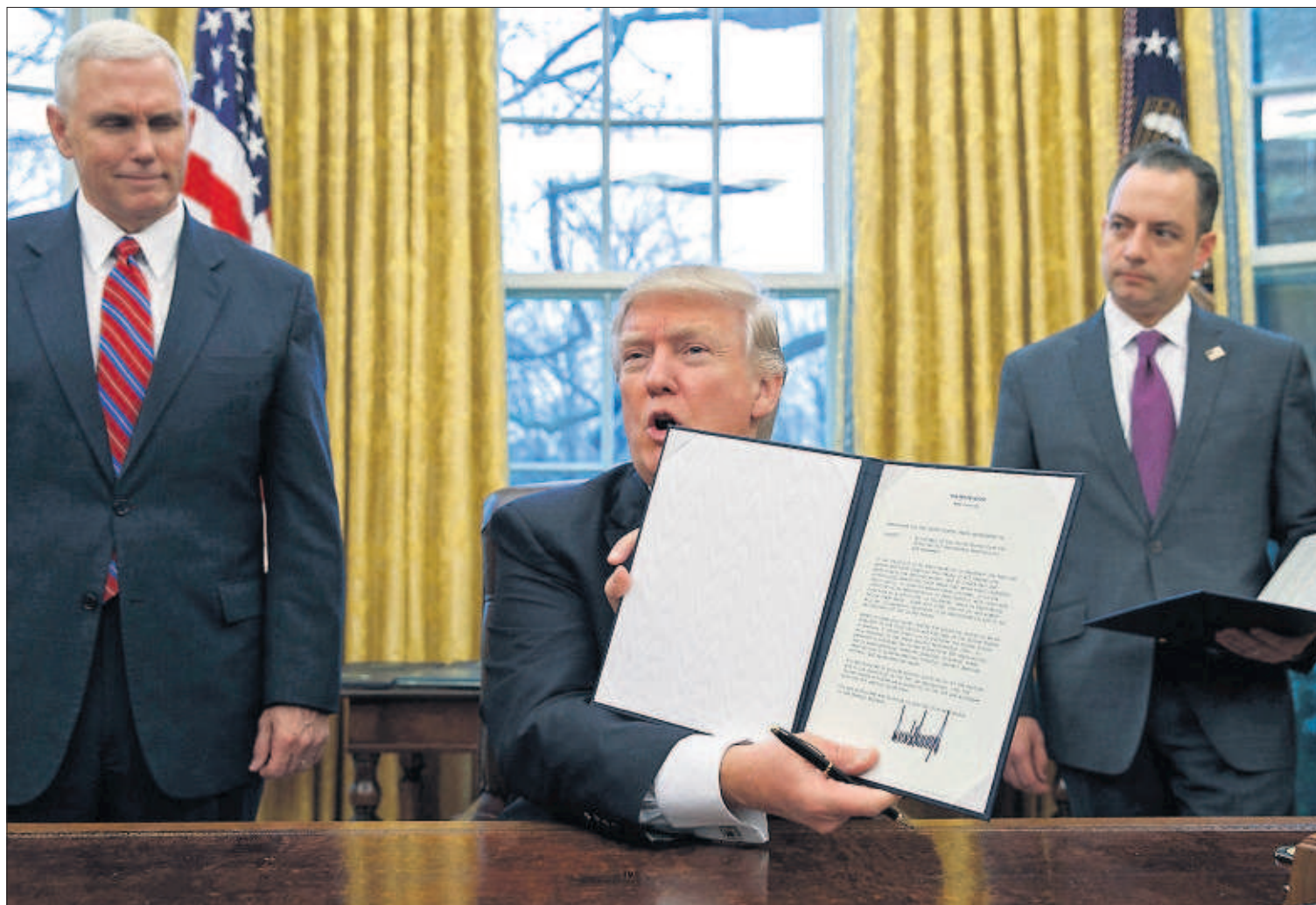
Trump muestra la firma de la orden de retirada del pacto comercial del Pacífico, junto al vicepresidente Pence (izquierda) y el jefe de Gabinete, Priebus.

Peña Nieto: "En los dos próximos años hay que redefinir la relación con Washington"