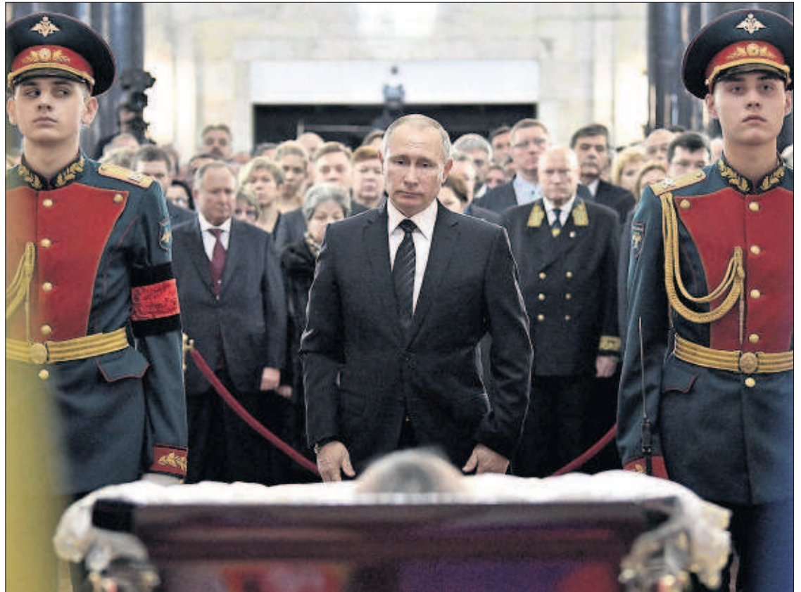
ÚLTIMO ADIÓS AL EMBAJADOR DE RUSIA EN TURQUÍA. El presidente ruso, Vladímir Putin, asistió ayer al funeral de su representante en Ankara, Andréi Kárllov, asesinado el lunes. En la foto, frente al féretro.

IAG lanzará vuelos de bajo coste a Latinoamérica P34