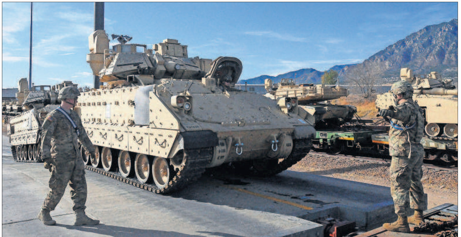
Miembros del décimo regimiento de caballería maniobran en Fort Carson, Colorado, el pasado noviembre.

0,25% en sus pagas, el mínimo que marca la ley. Las pensiones sufren así por primera vez desde 2012 una bajada de la capacidad de compra, que también afecta a funcionarios y gran parte de los asalariados. Para 2017 las pensiones volverán a subir solo el 0,25% y la previsión es que los precios aumenten más. PÁGINA 39