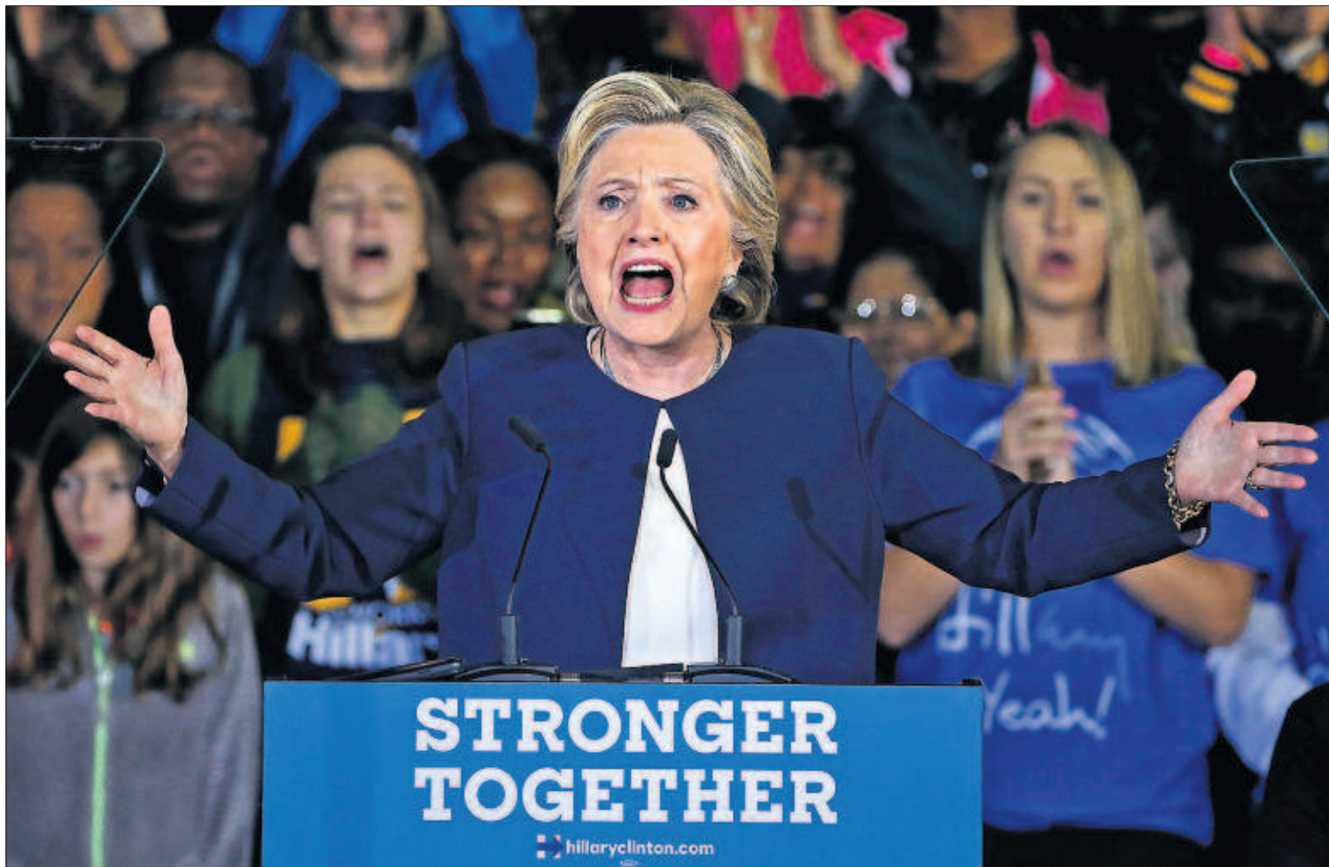
La candidata demócrata, Hillary Clinton, se dirige ayer a sus simpatizantes en Pittsburgh (Pensilvania).

esta fase del cuerpo a cuerpo en un puñado de Estados, se trata de convencer a los fieles de que la victoria es posible, y que para ello es vital que nadie deje de ir a las urnas. PÁGINA 4