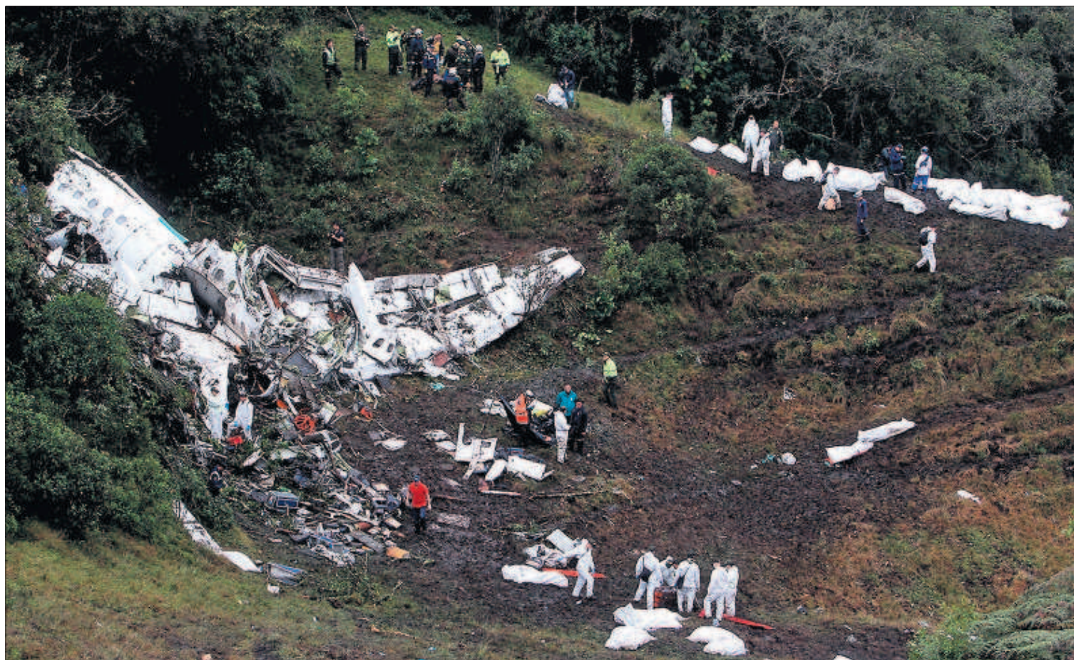
Los equipos de rescate recuperan los cuerpos de los viajeros junto al avión siniestrado en el departamento de Antioquia (Colombia).

Los creadores podrán seguir cobrando tras su jubilación P25