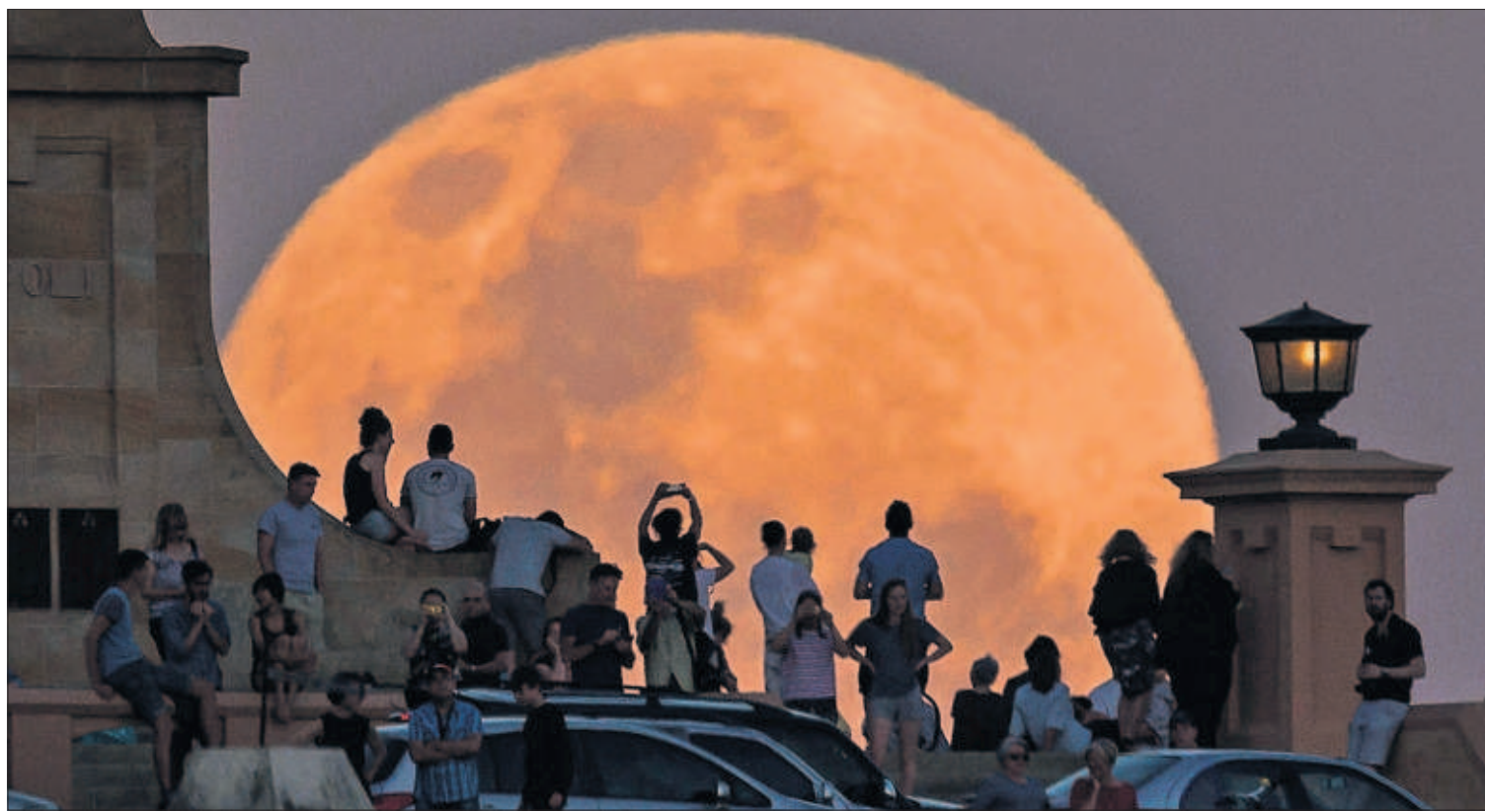
LA LUNA, MÁS CERCA Y MÁS BRILLANTE. La Luna se vio ayer más grande y luminosa que nunca desde 1948 gracias a su cercanía a la Tierra. En la superluna —el perigeo o punto más próximo— el diámetro aparente del satélite (en la imagen, fotografiado en la ciudad australiana de Fremantle) puede aumentar hasta un 14%, y su brillo, casi un 30% con respecto del apogeo, cuando registra su mayor distancia. PÁGINA 24

Videos de niños que juegan: ¿diversión o publicidad?