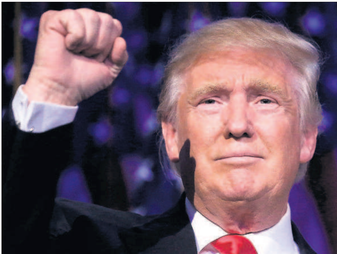
Donald Trump saluda a sus seguidores la noche del martes, tras conocerse los resultados.