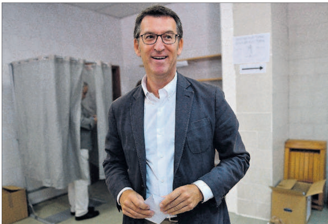
Alberto Núñez Feijóo se dispone a votar en un colegio de Vigo.

Alberto Núñez Feijóo, que anoche confirmó los pronósticos de victoria revalidando con holgura su mayoría absoluta, se sitúa después de estas elecciones en primera línea de salida para la eventual sucesión de Mariano Rajoy al frente del Gobierno de España. Independientemente de las incógnitas abiertas —terceras elecciones generales, el futuro de Rajoy, diversos escenarios del próximo congreso del partido—, Feijóo es ahora mismo, con el resultado de ayer, el único presidente de comunidad autónoma respaldado por una mayoría absoluta.