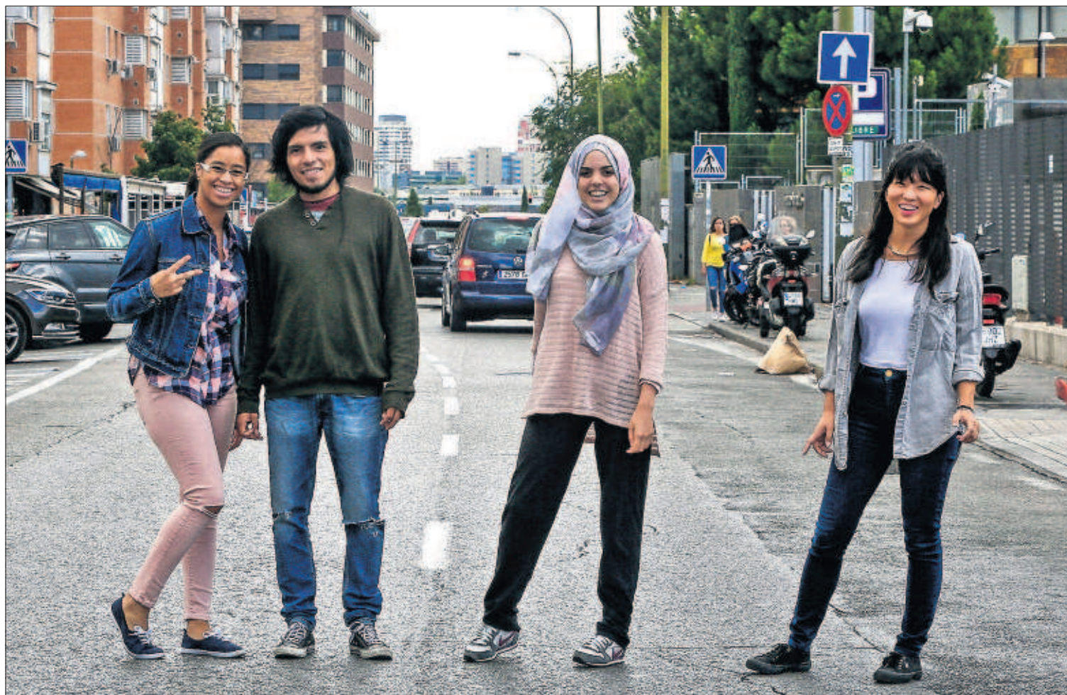
YO TAMBIÉN SOY ESPAÑOL. Hijos de inmigrantes nacidos en España, como los cuatro de la imagen tomada esta semana en Madrid, forman la llamada segunda generación, bien integrada y que aporta diversidad a un país históricamente homogéneo. / KIKE PARA PÁGINA 26

J. M. IRUJO / L. MAGÁN, Madrid Los cinco cuadros de Francis Bacon robados hace un año en Madrid a José Capelo, amigo y heredero del pintor, se intentaron vender en España en dos ocasiones. La última durante una reunión celebrada en una casa de Majadahonda (Madrid), según describe el sumario judicial. PÁGINA 29