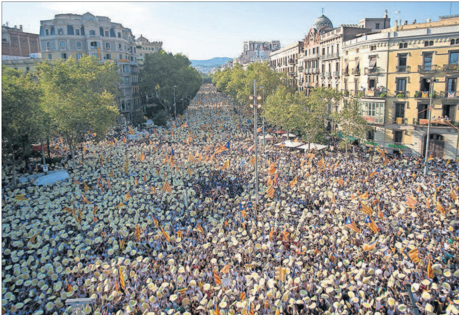
Un momento de la manifestación de la Diada celebrada ayer en Barcelona.

El presidente de EE UU defiende que la diversidad es la esencia de su país