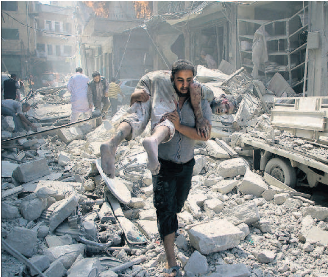
Un ciudadano sirio lleva a hombros a la víctima de un ataque aéreo, ayer en la ciudad rebelde de Idlib.