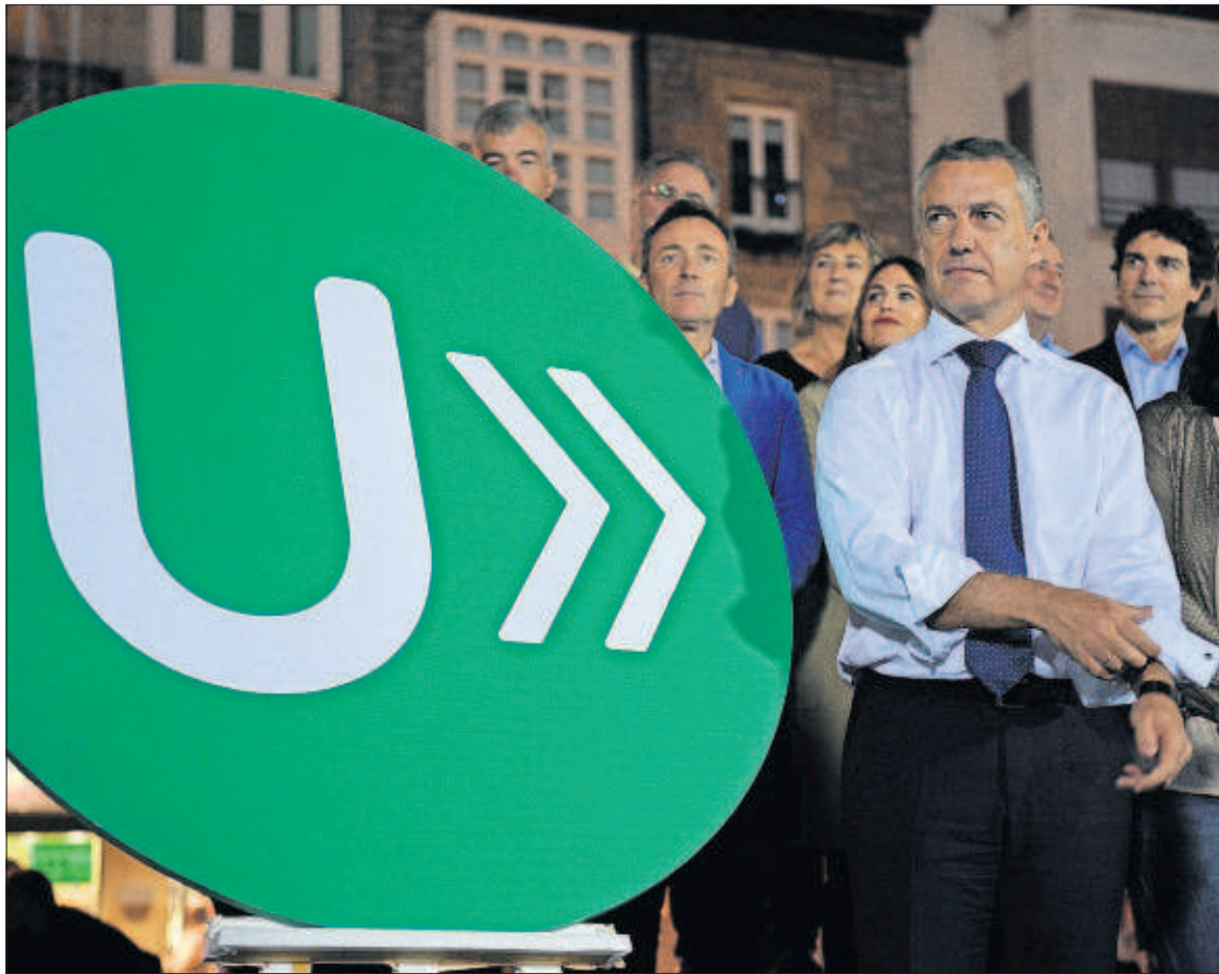
El candidato del PNV y lehendakari, Iñigo Urkullu, ayer en la apertura de su campaña en Vitoria.