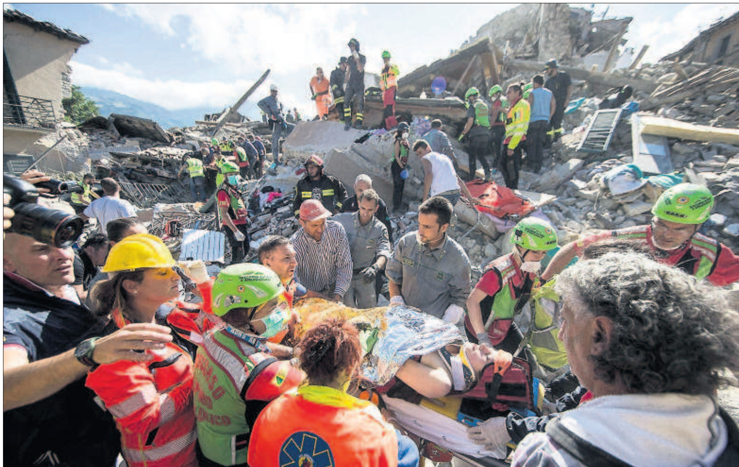
Equipos de salvamento rescatan ayer a una mujer de entre los escombros de la ciudad italiana de Amatrice.