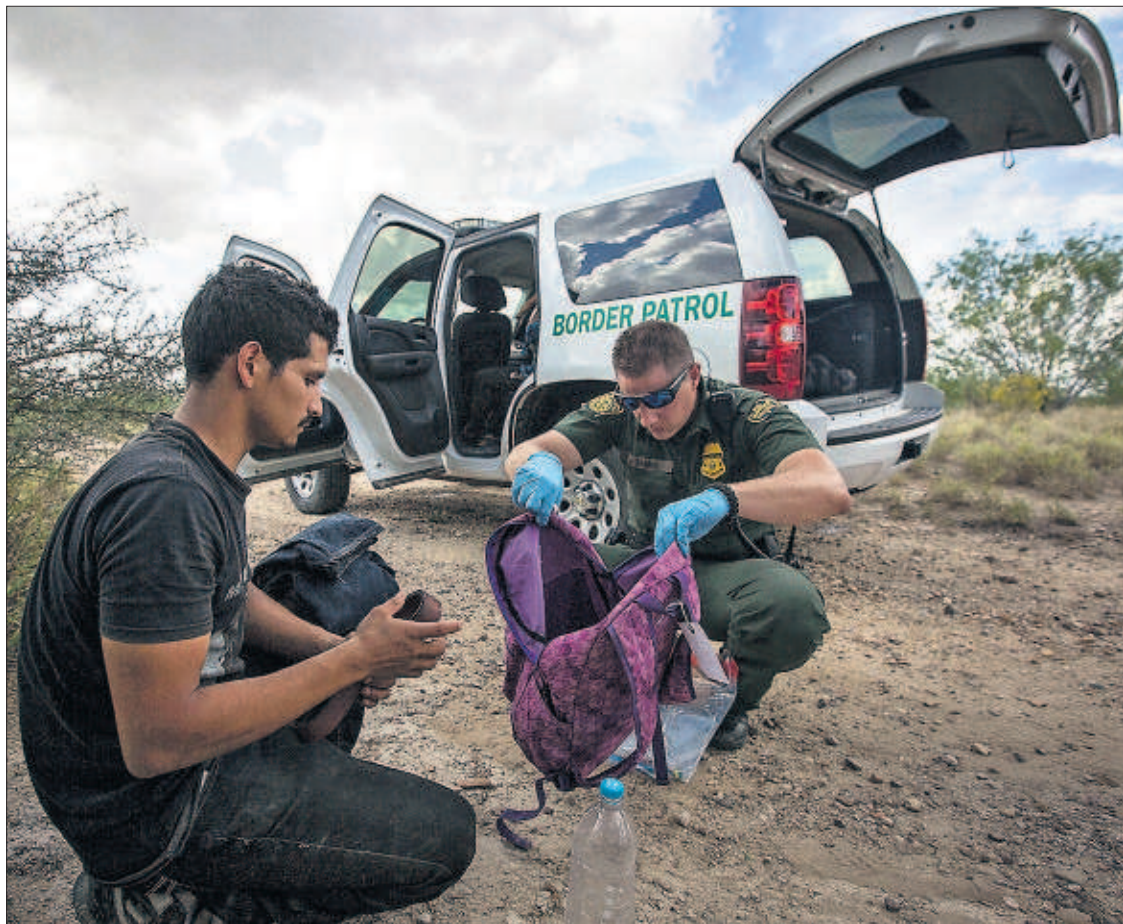
Un agente de la policía fronteriza de EE UU registra la mochila de un hondureño, interceptado junto a un grupo de inmigrantes centroamericanos tras cruzar la frontera con México.

Los dos partidos han acordado dejar lo más difícil para el final y plantear el pacto a todo o nada. La negociación se ha dividido en varios bloques: crecimiento económico, competitividad y empleo; sociedad de bienestar; transparencia, regeneración y lucha contra la corrupción; reforma y fortalecimiento institucional, y España en Europa y el mundo. Mientras, el PSOE prepara su discurso para el debate de investidura y perfila los argumentos para el no a Rajoy. PÁGINAS 13 Y 14