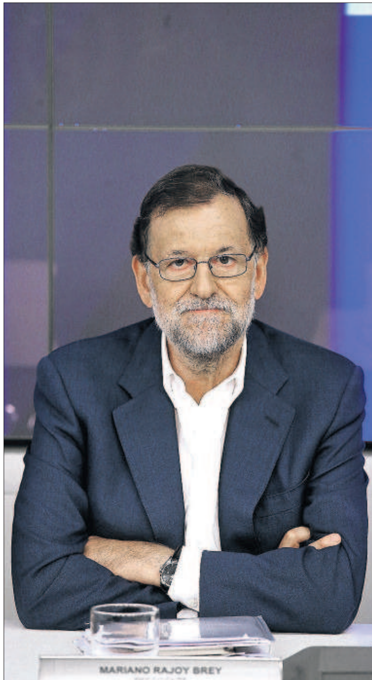
Rajoy, durante la reunión de ayer del comité ejecutivo del PP.