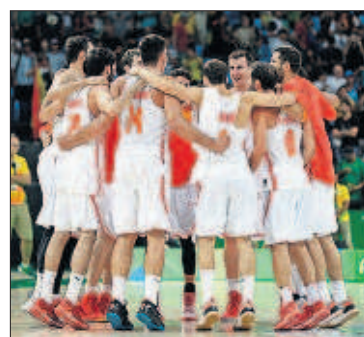
Los jugadores celebran el triunfo.

La selección masculina de baloncesto dejó ayer atrás el arranque renqueante en los Juegos y, como ocurrió contra Lituania y Argentina en los anteriores partidos, arrolló a Francia (92-67). La mejor generación del básquet español disputará su tercera semifinal olímpica consecutiva gracias a una gran actuación conjunta en la que brilló Mirotic. El equipo que lidera Pau Gasol luchará por au-