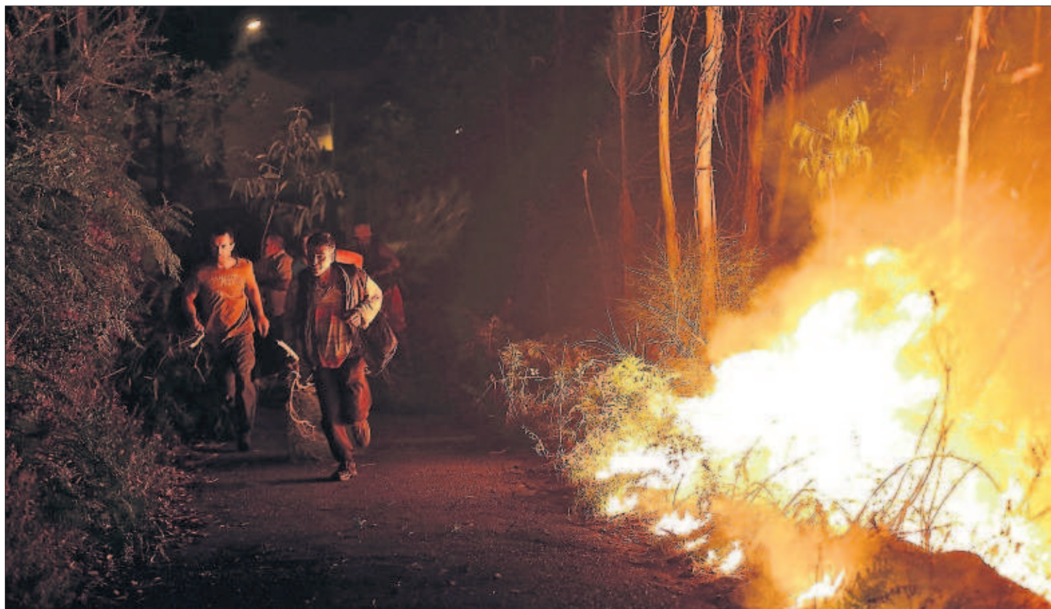
ARDE GALICIA. El fuego ha devorado en tres días más de 6.000 hectáreas de montes gallegos. Una mujer fue detenida ayer, acusada de haber provocado una quincena de incendios. En la imagen, varios vecinos intentan sofocar las llamas en Arbo (Pontevedra). PÁGINA 16

Mientras París espera repuntar en los próximos meses, Alemania despegó imparable gracias a la fortaleza de sus exportaciones y mantiene la tasa de desempleo en su nivel más bajo desde la reunificación, hace 25 años. El PIB español fue el segundo que más creció (0,7%), tras Eslovaquia (0,9%). PÁGINA 35