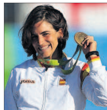
Chourraut, con la medalla de oro.

Mireia Belmonte logró en la madrugada de ayer su sueño frustrado de hace cuatro años: ganar la final olímpica de 200 mariposa. Lo hizo en una emocionante carrera que la coronó como la primera mujer española que logra un oro en natación, uno de los deportes olímpicos por excelencia, junto con el atletismo y la gimnasia. Belmonte abrió la senda del oro para el equipo español. A última hora de la tarde, Maialen