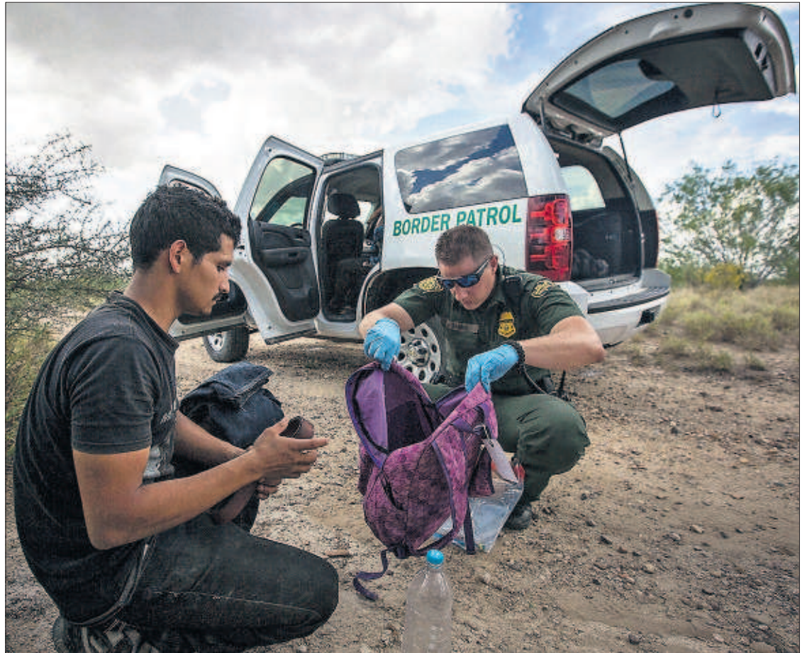
Un agente de la policía fronteriza de EE UU registra la mochila de un hondureño, interceptado junto a un grupo de inmigrantes centroamericanos tras cruzar la frontera con México.

Los dos partidos han acordado dejar lo más difícil para el final y plantear el pacto a todo o nada. La negociación se ha dividido en varios bloques: crecimiento económico, competitividad y empleo; sociedad de bienestar; transparencia, regeneración y lucha contra la corrupción; reforma y fortalecimiento institucional, y España en Europa y el mundo. Mientras, el PSOE prepara su discurso para el debate de investidura y perfila los argumentos para el no a Rajoy. PÁGINAS 13 Y 14