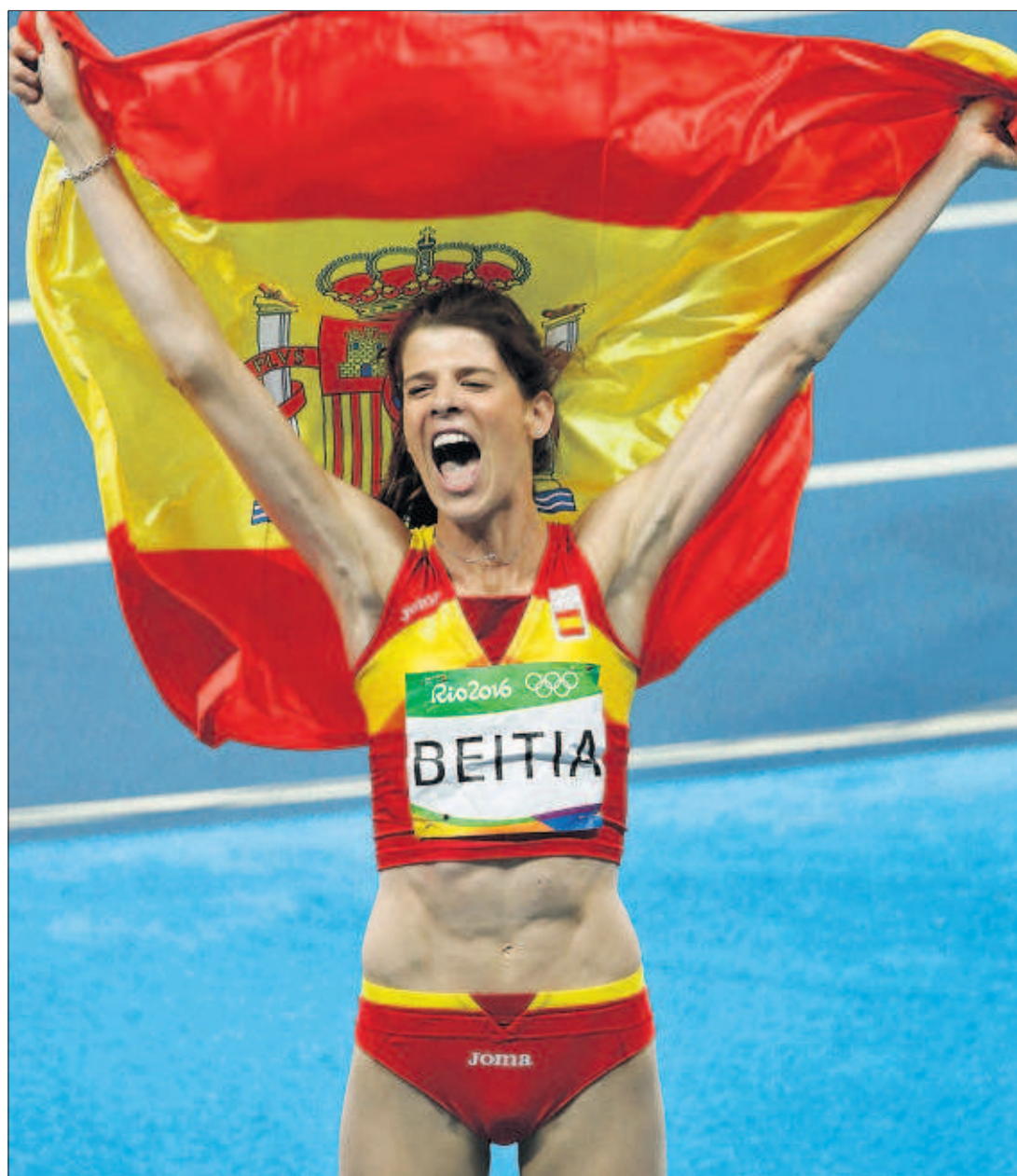
Ruth Beitia celebra su medalla de oro en salto de altura en los Juegos Olímpicos.