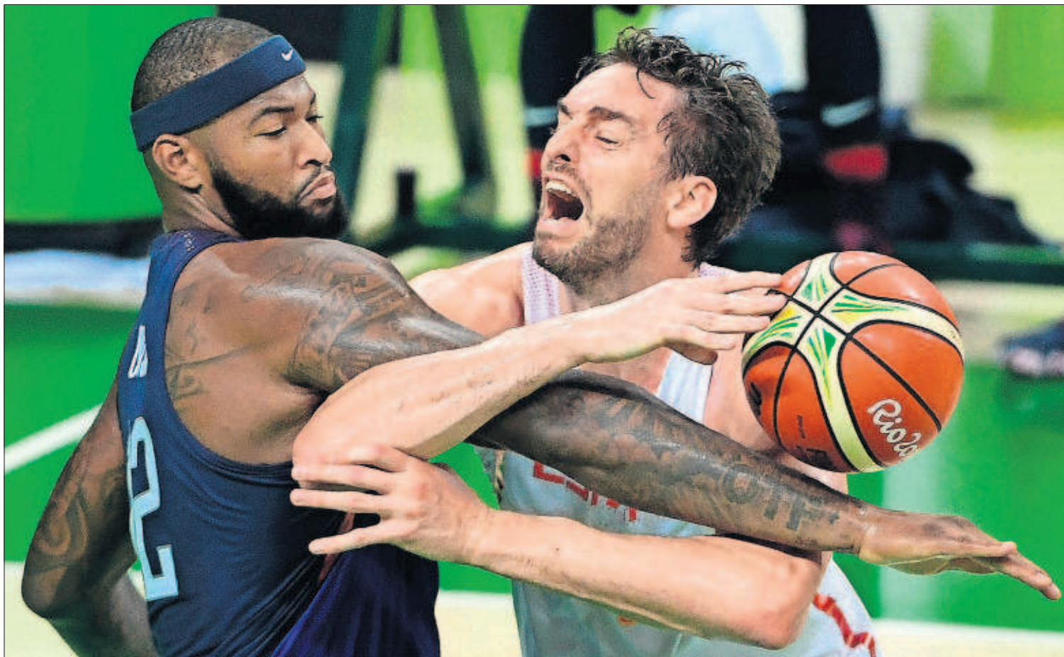
HASTA EL ÚLTIMO ALIENTO. España soñó anoche con la medalla de oro de baloncesto y se la disputó a brazo partido en las semifinales contra Estados Unidos, que ganó 82-76. Ahora toca luchar por el bronce. En la imagen, Cousins y Gasol, autor de 23 puntos. PÁGINA 36

EL PAÍS adelanta extractos de la esperada segunda entrega de los diarios del escritor argentino.