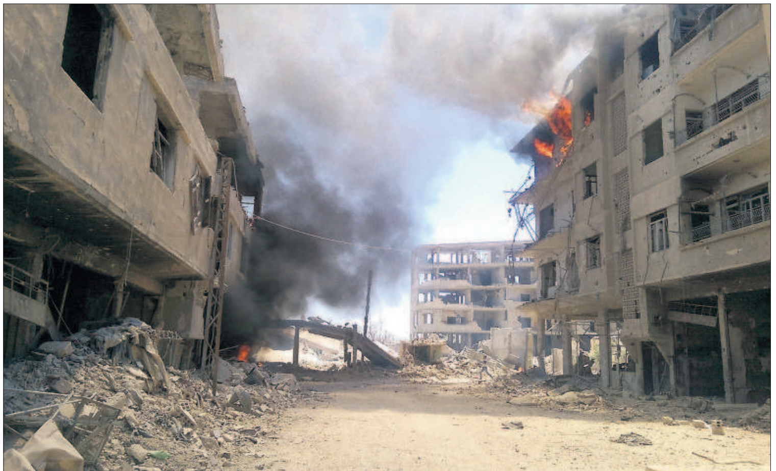
FADI DIRANI (AFP)