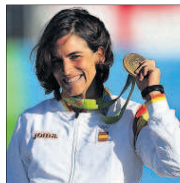
Chourraut, con la medalla de oro.

Mireia Belmonte logró en la madrugada de ayer su sueño frustrado de hace cuatro años: ganar la final olímpica de 200 mariposa. Lo hizo en una emocionante carrera que la coronó como la primera mujer española que logra un oro en natación, uno de los deportes olímpicos por excelencia, junto con el atletismo y la gimnasia. Belmonte abrió la senda del oro para el equipo español. A última hora de la tarde, Maialen