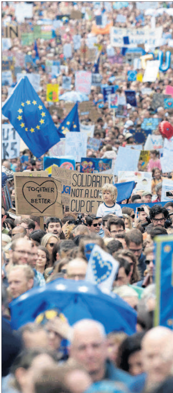
"PARAD ESTA LOCURA". Este era uno de los lemas que decenas de miles de personas corearon ayer por las calles de Londres para pedir un segundo referéndum que evite la ruptura de Reino Unido con la UE. La reina Isabel hizo un llamamiento a la calma. / P. H. (REUTERS) P4