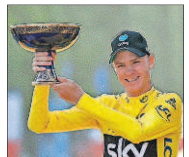
El británico Froome gana el Tour por tercera vez

CARLOS ARRIBAS, París Rusia podrá participar en los Juegos de Río pese al escándalo del dopaje masivo. Pero, según decidió ayer el COI, solo acudirán los deportistas "limpios".