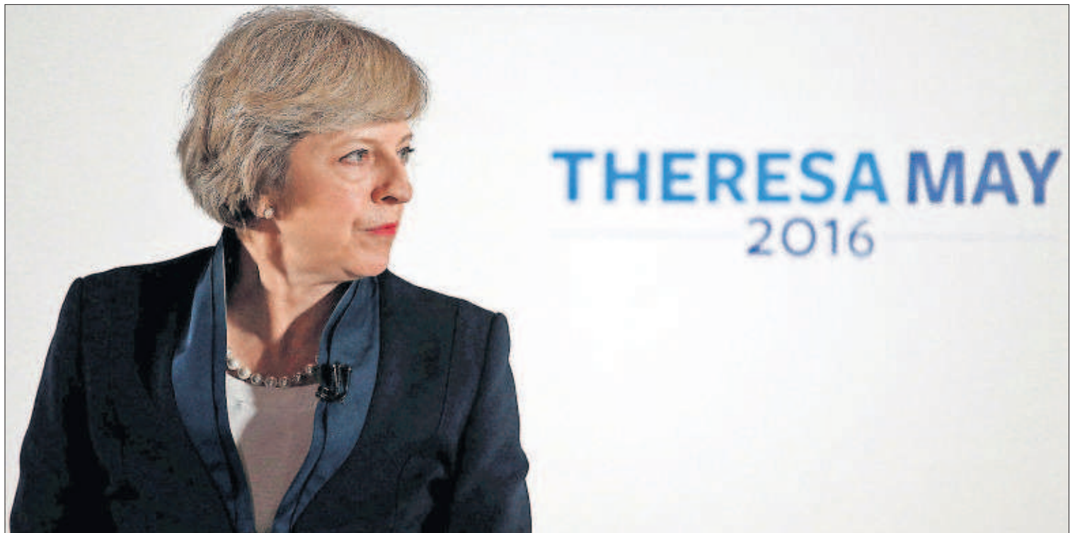
La líder de los conservadores británicos, Theresa May, ayer durante una comparecencia en Birmingham.

alpinas acaparan un tercio de todos los créditos morosos de la zona euro: 360.000 millones, el 22% del PIB italiano. Si se combina esto con una deuda elevada y un crecimiento frágil, el cóctel es explosivo y “el contagio regional y global puede ser significativo dado el peso sistémico de Italia”, advierte el Fondo. PÁGINA 39