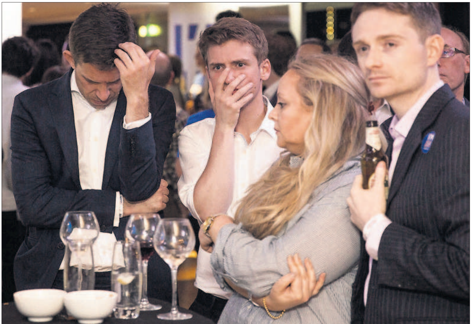
Partidarios de la permanencia en la UE desolados y perplejos por la victoria del Brexit, ayer en el Royal Festival Hall de Londres.