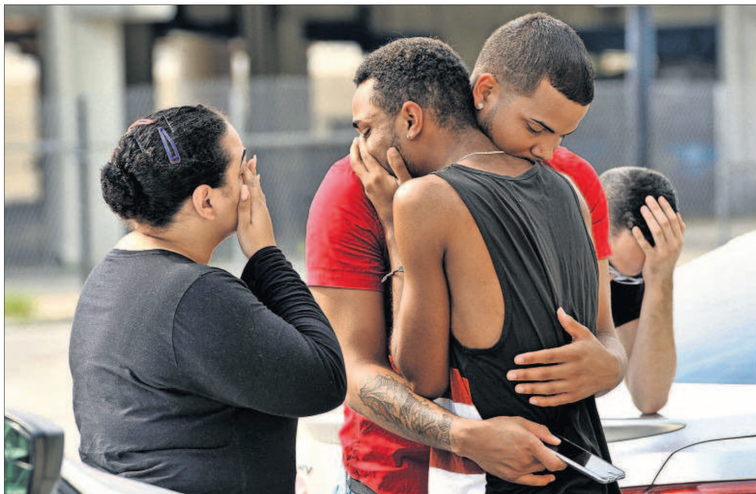
Familiares y amigos de las víctimas del atentado del club Pulse se abrazan emocionados, ayer en Orlando.

El padre del asesino niega que estuviese guiado por motivos religiosos