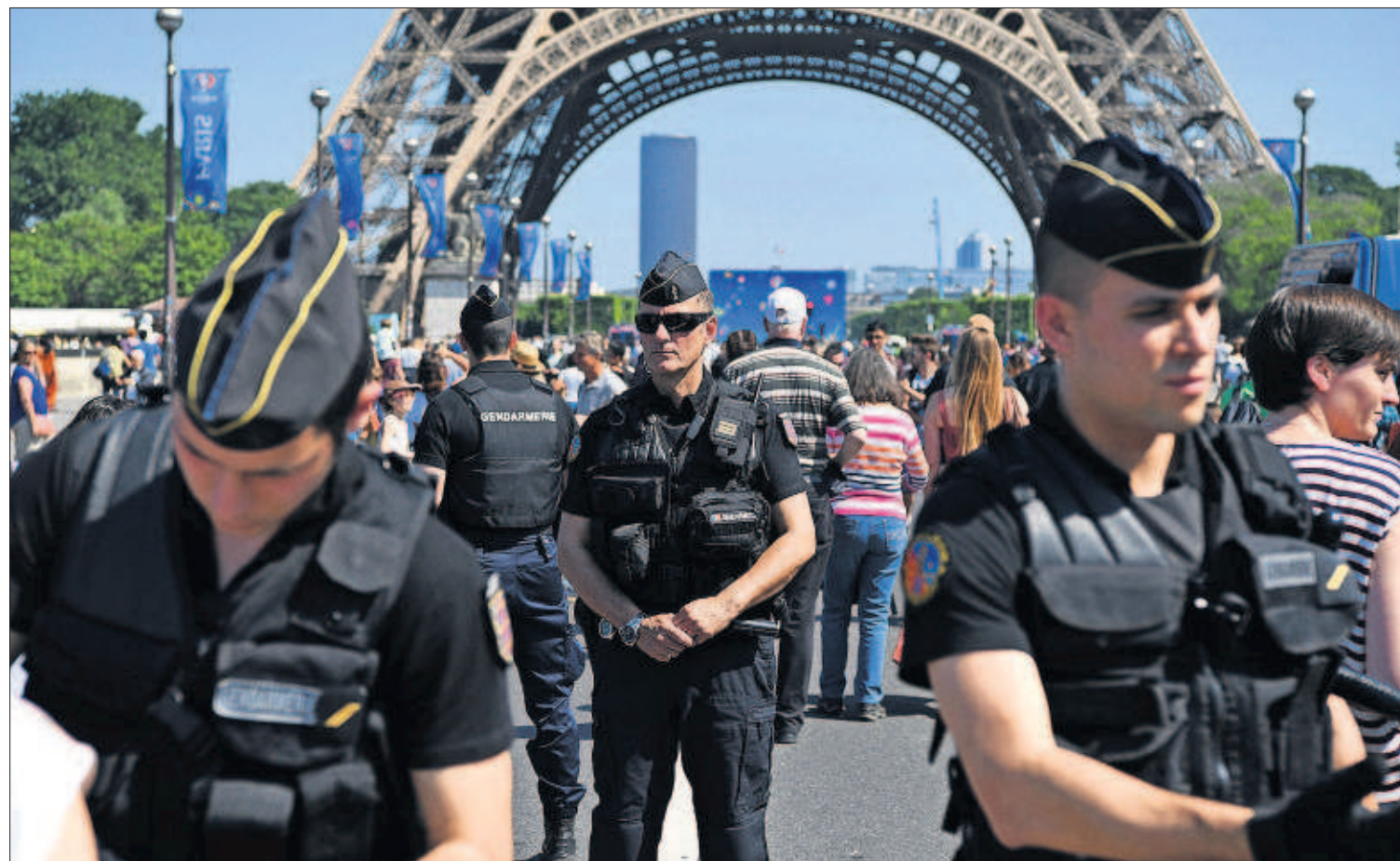
Agentes de la Gendarmería vigilan las inmediaciones de la Torre Eiffel como parte de las medidas de seguridad por la Eurocopa.

'Gilliamismos', el libro de memorias de Terry Gilliam P27