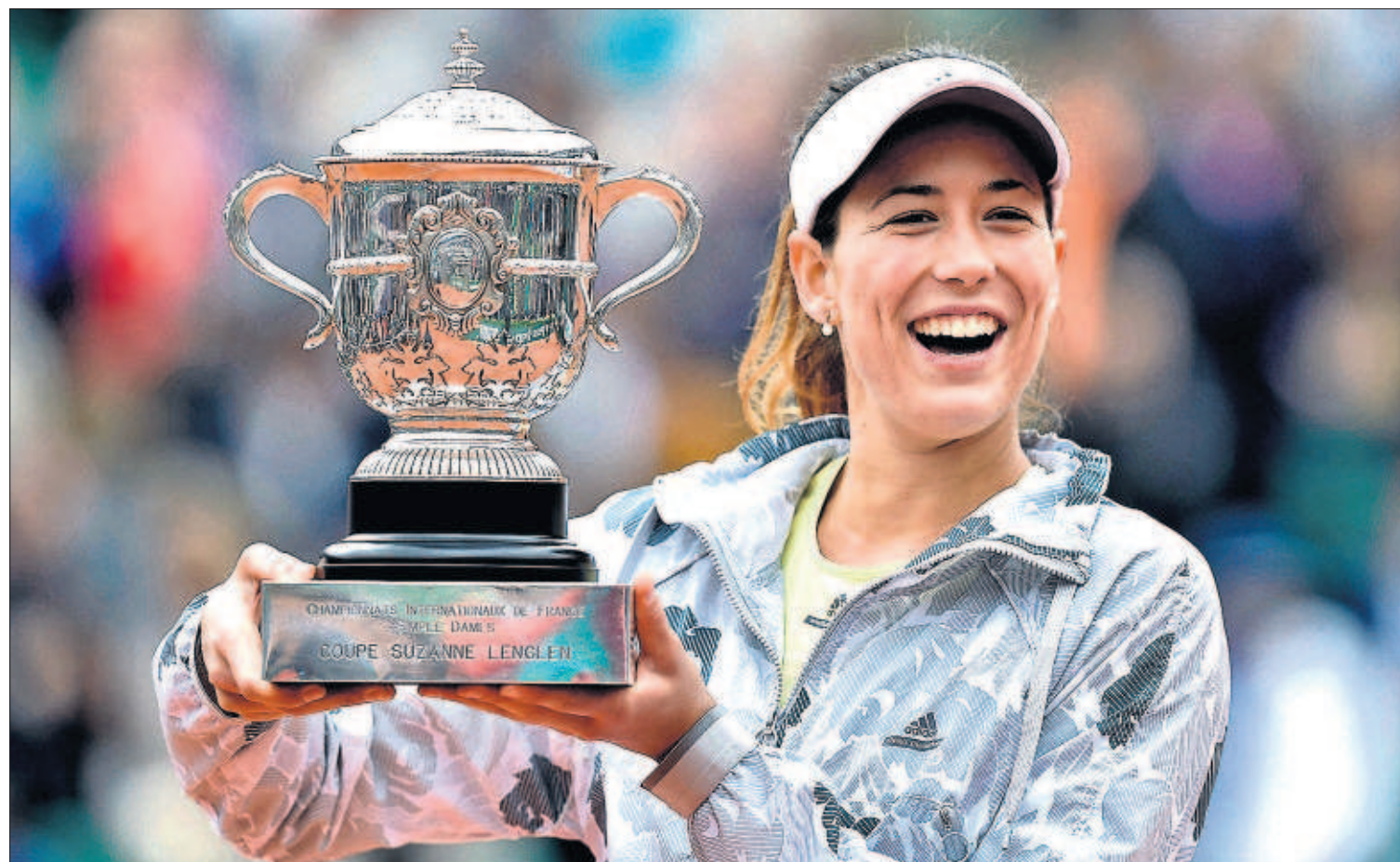
MUGURUZA ARROLLA EN PARÍS. Con un juego majestuoso y calmado, la tenista española Garbiñe Muguruza, de 22 años, logró arrebatar en dos sets la final del Roland Garros a la número uno del mundo, la estadounidense Serena Williams. PÁGINA 26 Y 27

Consigue la revista, por solo un euro más, con EL PAÍS