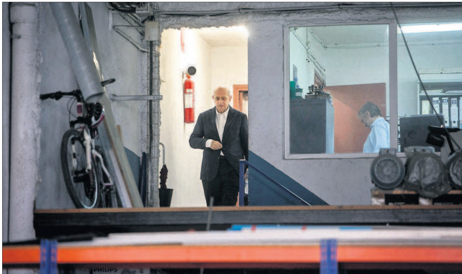
El ministro del Interior, Jorge Fernández Díaz, ayer durante una visita de campaña a una cerrajería en Viladecans (Barcelona).

España, el país europeo donde más aumentan los ricos P40