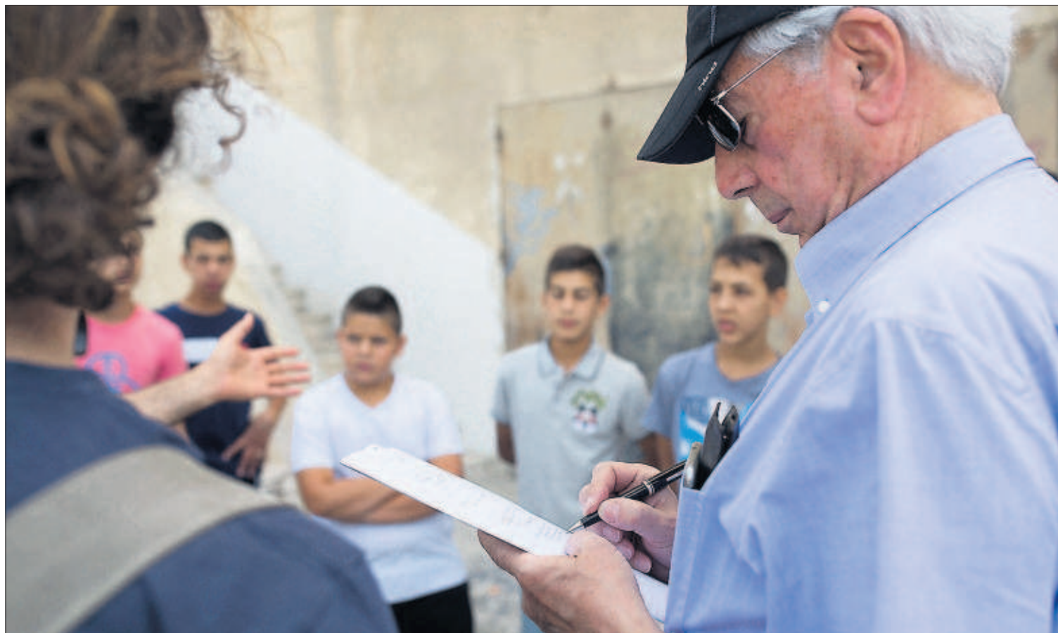
EL NOBEL DE LITERATURA VUELVE AL REPORTAJE. Mario Vargas Llosa ha regresado a Israel y a los territorios ocupados para conocer los dramas de sus habitantes. Dentro de dos semanas EL PAÍS publicará sus artículos y vídeos. PÁGINA 37