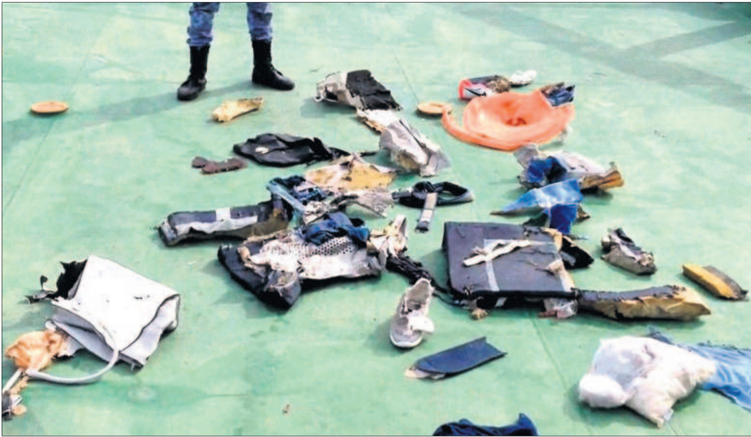
ALERTAS DE HUMO A BORDO DEL AVIÓN EGIPCIO. El Airbus A320 de EgyptAir desaparecido el jueves emitió varias alertas de presencia de humo en la cabina unos minutos antes de esfumarse de los radares, en el trayecto París-El Cairo. Los expertos no han determinado las causas. El Ejército egipcio ofreció ayer en las redes sociales imágenes de los primeros restos hallados en el Mediterráneo. P3

ELENA G. SEVILLANO, Madrid La estación del AVE de Requena (Valencia) costó 12,4 millones de euros y solo recibe 20 pasajeros al día. Mucho más que la de Tardienta (Huesca), por la que transita de media una persona. Son dos de las ocho terminales más infrautilizadas de la red de alta velocidad, compuesta en total por 29, en las que se han invertido 47.000 millones en dos décadas. PÁGINA 47