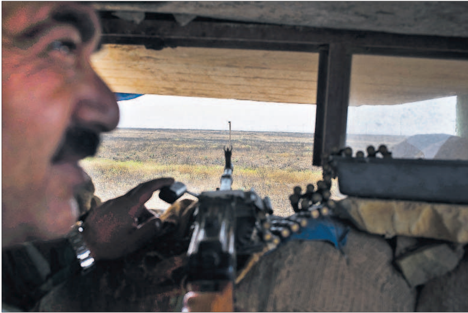
Un combatiente kurdo hace guardia en la línea del frente cerca de Majmur, en el norte de Irak.

HENRIQUE CAPRILES Líder opositor venezolano