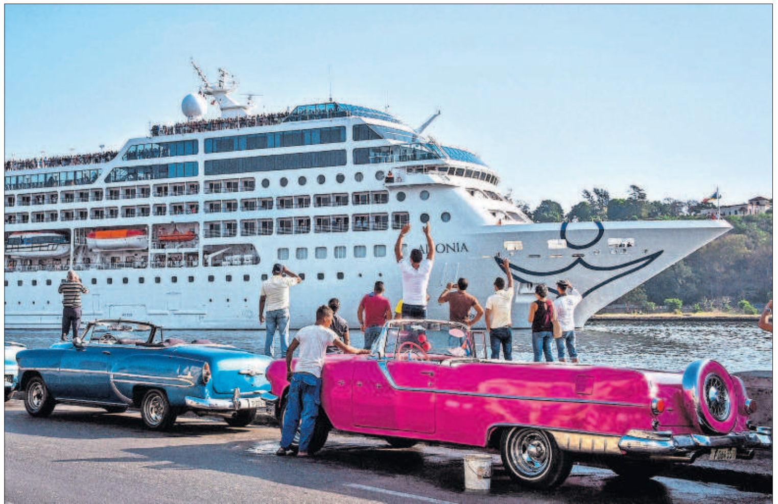
AMARRE HISTÓRICO EN LA HABANA. El Adonia se convirtió ayer en el primer crucero que arriba a Cuba procedente de EE UU en más de medio siglo. El histórico viaje de Miami a La Habana, donde atracó sobre las tres de la tarde, supone uno de los avances más nítidos de la normalización de relaciones entre ambos países. En la imagen, un grupo de cubanos saluda la llegada del barco. / ADALBERTO ROQUE (AFP) PÁGINA 5

tiempo adicional será de solo un año, cuando la petición del Gobierno que preside en funciones Mariano Rajoy era de dos. La Comisión entiende que un ejercicio es tiempo más que suficiente para corregir las cifras si España cumple con los ajustes que Bruselas pondrá sobre la mesa en un par de semanas. PÁGINA 37