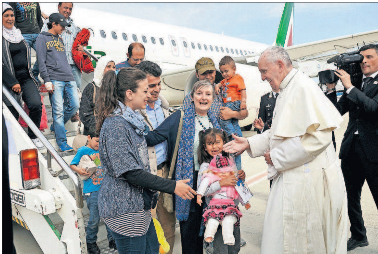
EL PAPA ACOGE A TRES FAMILIAS SIRIAS EN EL VATICANO. El papa Francisco culminó ayer una visita a los refugiados en la isla griega de Lesbos con un gesto inesperado: se llevó consigo a tres familias sirias (doce personas, seis de ellas niños, todas musulmanas) que acogerá el Vaticano. En la foto, los refugiados saludan al Pontífice a su llegada al aeropuerto de Roma. PÁGINAS 2 Y 3 / EDITORIAL EN LA PÁGINA 12

explicaciones precipitadas sin saber de lo que hablaba. Y reta a su excolega, con el que ha mantenido tensiones notorias en el Consejo de Ministros: “Montoro hará muy bien en investigarme. No va a encontrar nada”. Mientras, Rajoy, dedicado a la campaña electoral, eludió el tema ayer en Zaragoza. PÁGINA 16