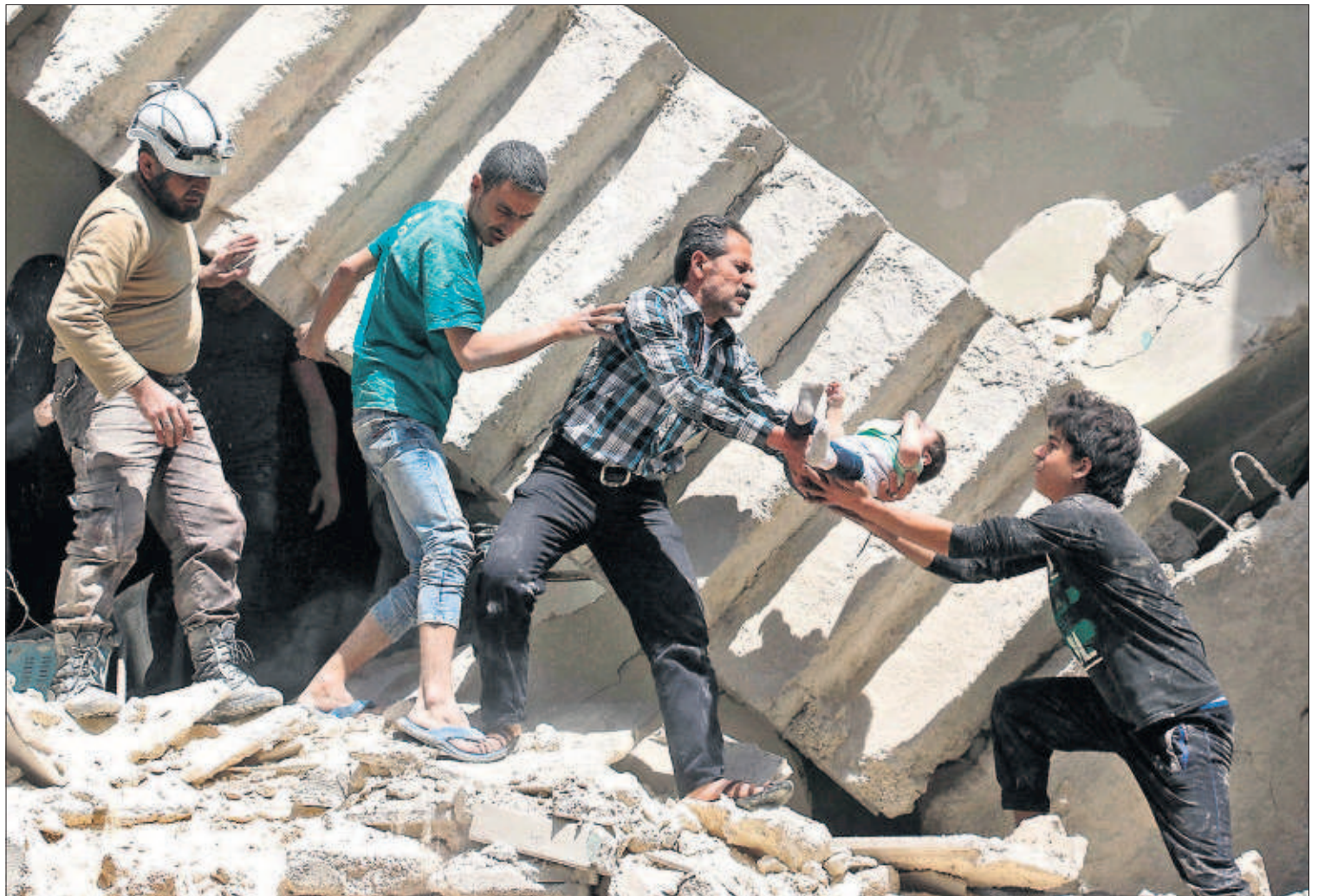
LA ESPERANZA DE PAZ EN SIRIA CAMINA AL BORDE DEL ABISMO. El ataque aéreo a un hospital de Aleppo en el que trabaja Médicos Sin Fronteras causó ayer al menos 27 muertos. La matanza se suma a la reciente escalada de violencia que socava el cese de las hostilidades en Siria. En la imagen, cuatro hombres rescatan a un bebé de uno de los edificios bombardeados en dicha ciudad. PÁGINA 4