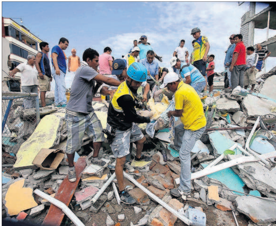
Vecinos de Pedernales (Ecuador) sacan un cadáver entre los escombros, ayer tras el terremoto.

Los equipos españoles que competirán en Río