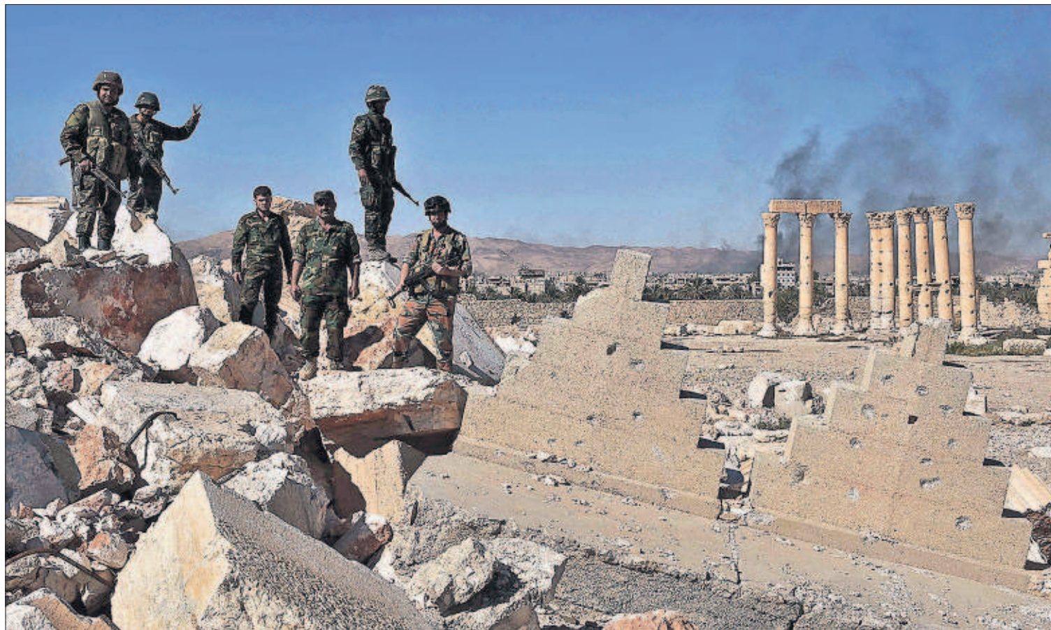
PALMIRA DEJA ATRÁS EL HORROR DEL CALIFATO. Una ciudad fantasma, sembrada de fosas y minas. Es la huella del ISIS en Palmira, recuperada por el Ejército sirio tras diez meses de ocupación, y que ha visitado una periodista de EL PAÍS. Ya nada será igual, dicen los vecinos, aliviados por la liberación. Ni siquiera el teatro romano, escenario de terribles ejecuciones. / NATALIA SANCHA P3

NATALIA JUNQUERA, Sevilla Metido de lleno en campaña electoral, Mariano Rajoy propuso ayer en Sevilla cinco medidas para facilitar la conciliación, entre ellas que la jornada laboral con carácter general acabe a las seis de la tarde y que España adopte el horario de Canarias. Esas propuestas figuran en el pacto de PSOE y Ciudadanos. PÁGINA 23