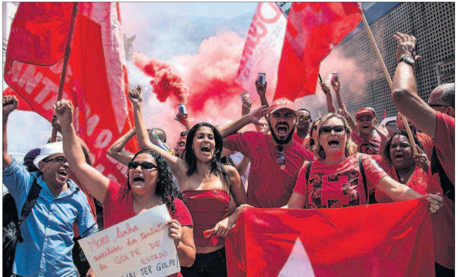
CHRISTOPHE SIMON (AFP)