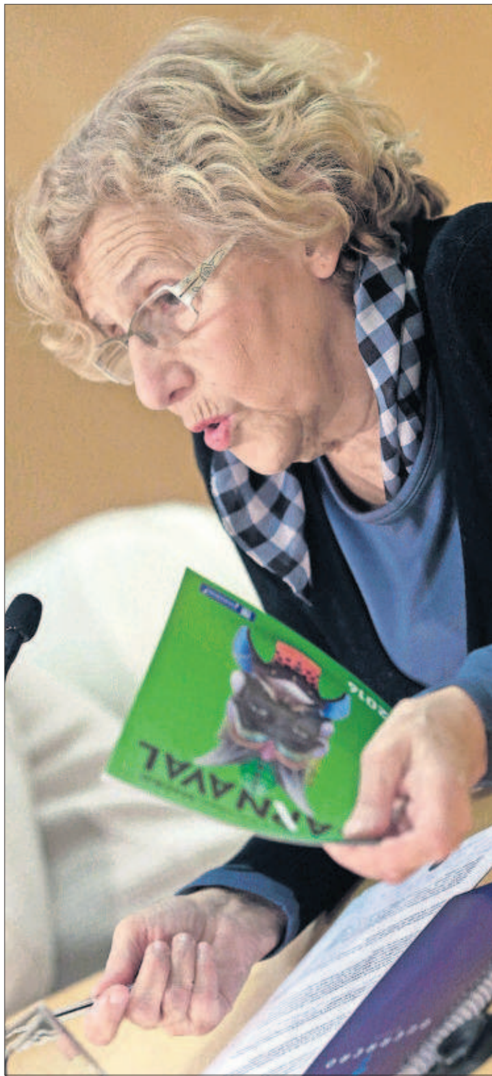
JAVIER LIZÁN (EFE)

A España, cuyo principal índice bursátil ya cerró 2015 con un descenso del 7,1%, esta inestabilidad le sorprende en un contexto de incógnita política. Ha pasado más de un mes desde las elecciones y las negociaciones de investidura solo han comenzado, sin visos de que se forme un Gobierno estable en los próximos meses. No hay mayorías suficientes y la opción de una repetición de las elecciones no se ha disipado del horizonte, lo que podría prolongar meses la actual situación de Ejecutivo en funciones, aunque las Cortes estén ya formadas. PÁGINAS 38 Y 39