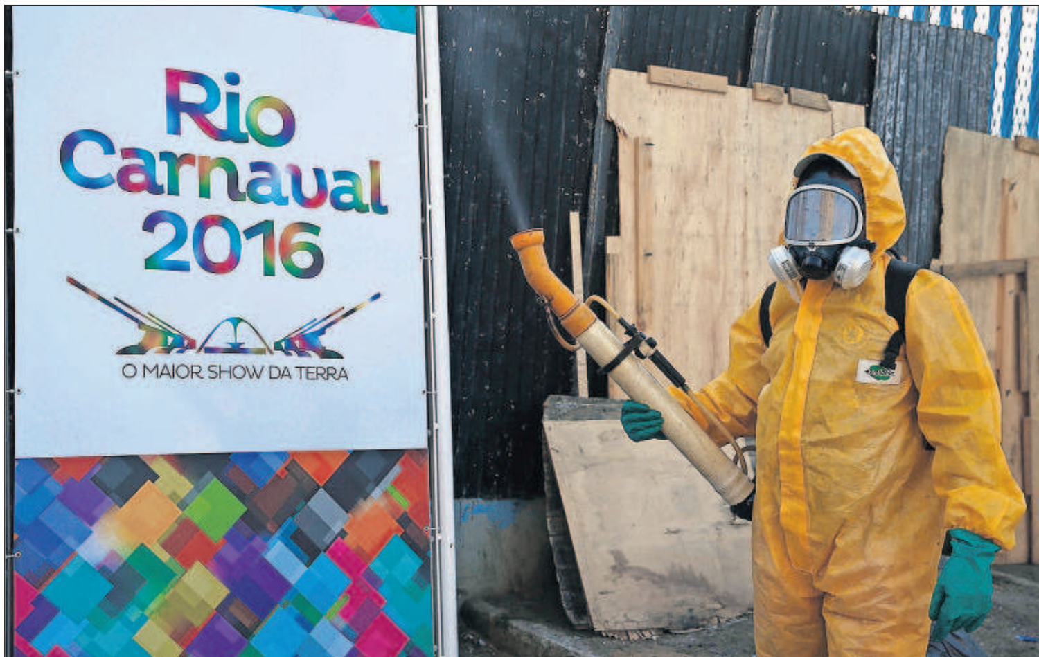
Un trabajador del departamento de salud de Río de Janeiro desinfecta ayer las instalaciones del sambódromo.

Nuevo juicio en Costa Rica por la muerte de Jairo Mora P8